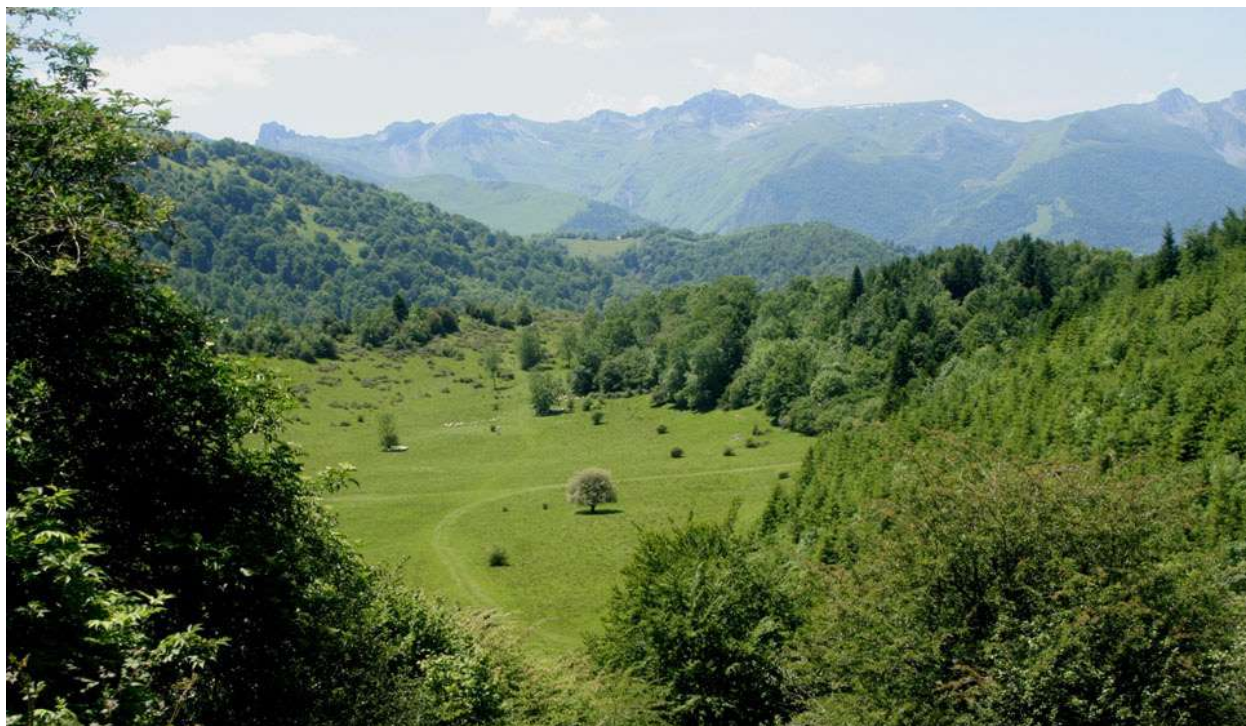
Le plateau du quartier Ugès