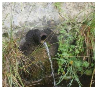
Source en bord de piste dans le quartier Quatrou