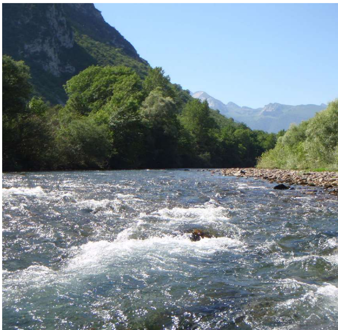
Gave d'Ossau en amont du lac de Castet

1 710381 E - 4763346 N Tourner à droite et traverser le gave. Au stop tourner à gauche puis à droite pour remonter la rue du Bourguet qui vous mènera au point de départ.