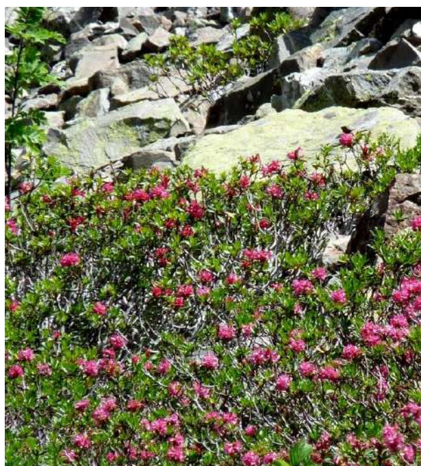
Rhododendrons dans les éboulis.

3h30 4 704088 E – 4756319 N Reprendre le même chemin pour la descente.